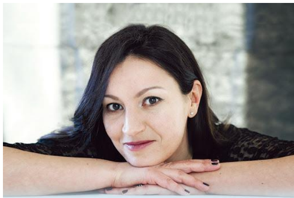
ILARIA TUTI SCRITTRICE

ILARIA TUTI vive a Gemona del Friuli, in provincia di Udine. Appassionata di pittura, nel tempo libero ha fatto l'illustratrice per una piccola casa editrice. Il thriller Fiori sopra l'inferno , edito da Longanesi nel 2018, è il suo libro d'esordio. Il secondo romanzo, Ninfa dormiente , è del 2019. Entrambi vedono come protagonisti il commissario Teresa Battaglia, uno straordinario personaggio che ha conquistato editori e lettori in tutto il mondo, e soprattutto la terra natia dell'autrice, la sua storia, i suoi misteri. Non si può non volerle bene: a Teresa e anche a Ilaria, per quello che scrive e per la persona che è.